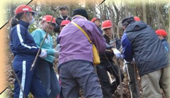
未来に届ける卒業記念・桜の植樹