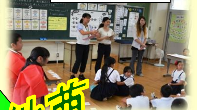
学んだ英語を使おう！